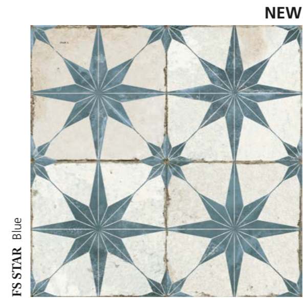
FS STAR Blue