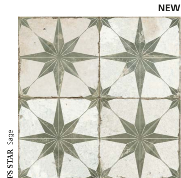
FS STAR Sage