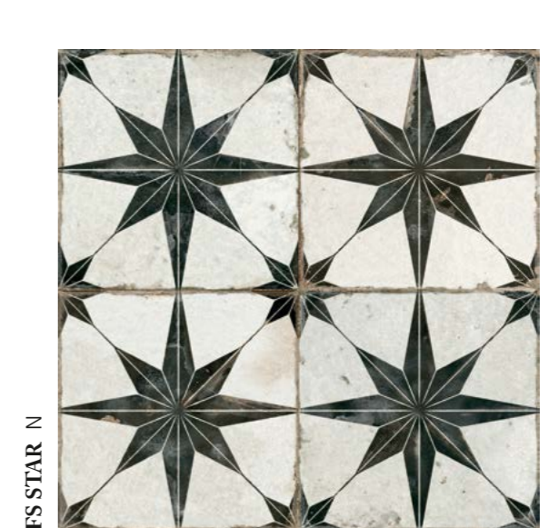
FS STAR N